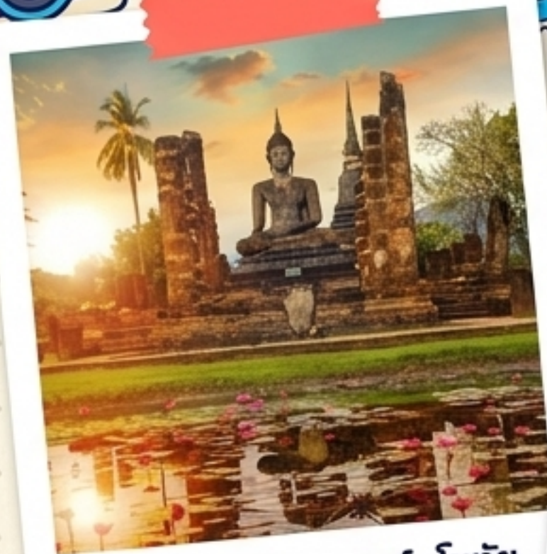
อุทยานประวัติศาสตร์สุโขทัย - มรดกโลกจากยูเนสโก