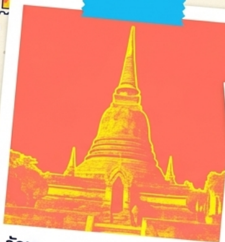
วัดมหาธาตุ - ศูนย์กลางศาสนา เจดีย์ทรงดอกบัวตูม