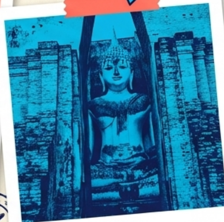
วัดศรีชุม - พระพุทธรูปยักษ์และศิลาจารึก