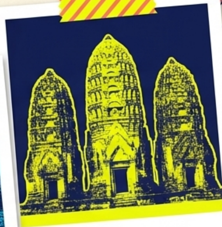
วัดศรีสวาย - อดีตทิวสถานอินดู