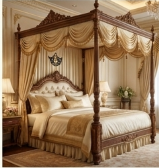
พระยี่งู (เตียง)