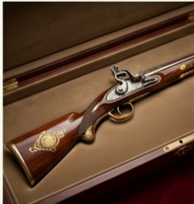
พระแสงปืน (ปืน)