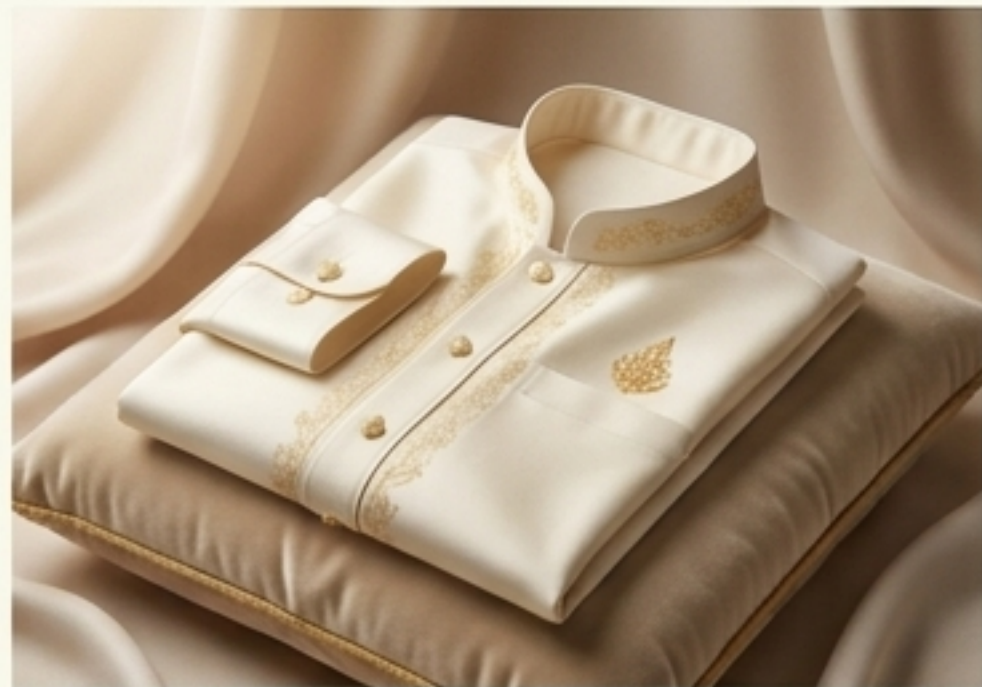
ฉลองพระองค์ (เสื้อ)