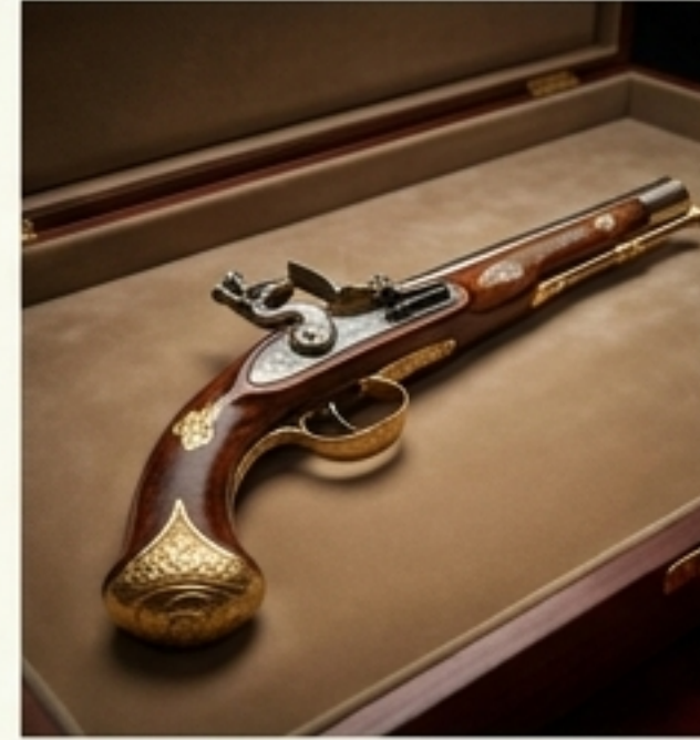
พระแสงปืน (ปืน)