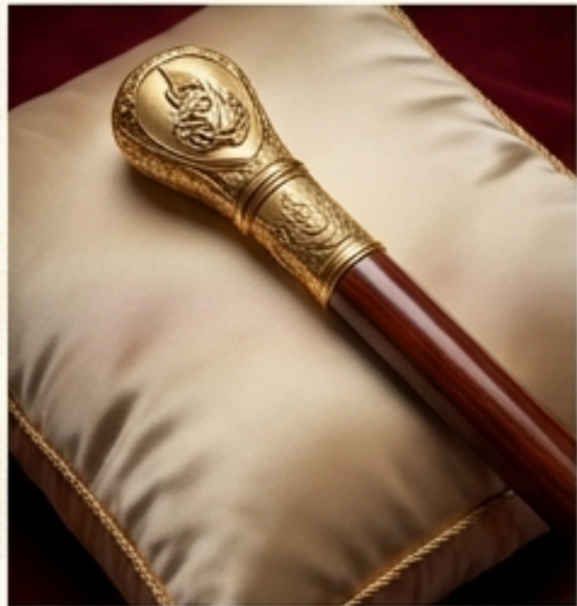
ธรรพระกร (ไม้เท้า)