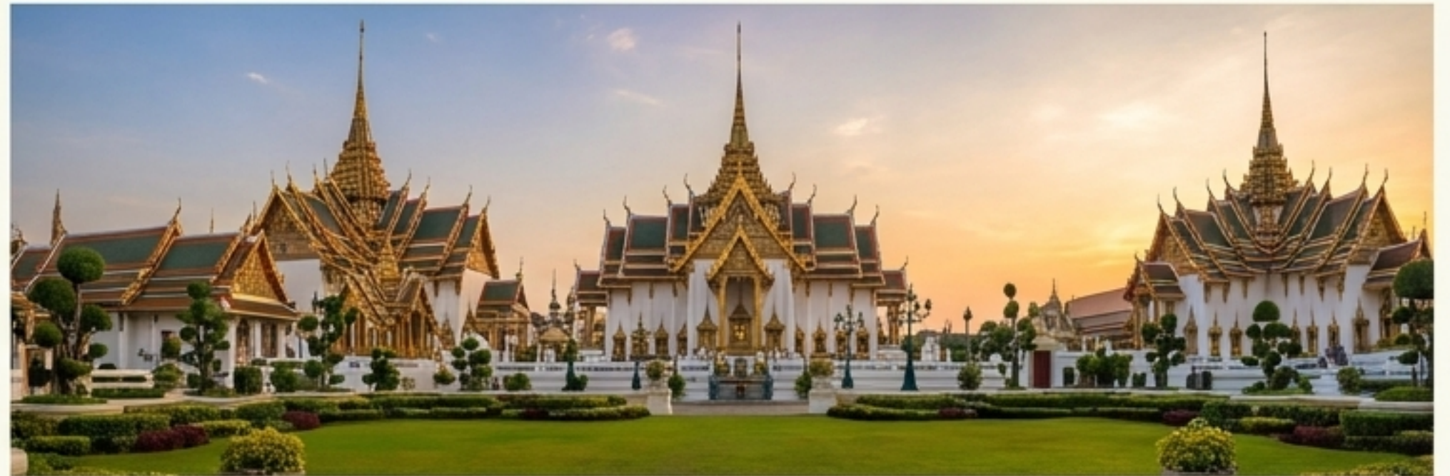
พระราชวัง (ที่ประทับ)