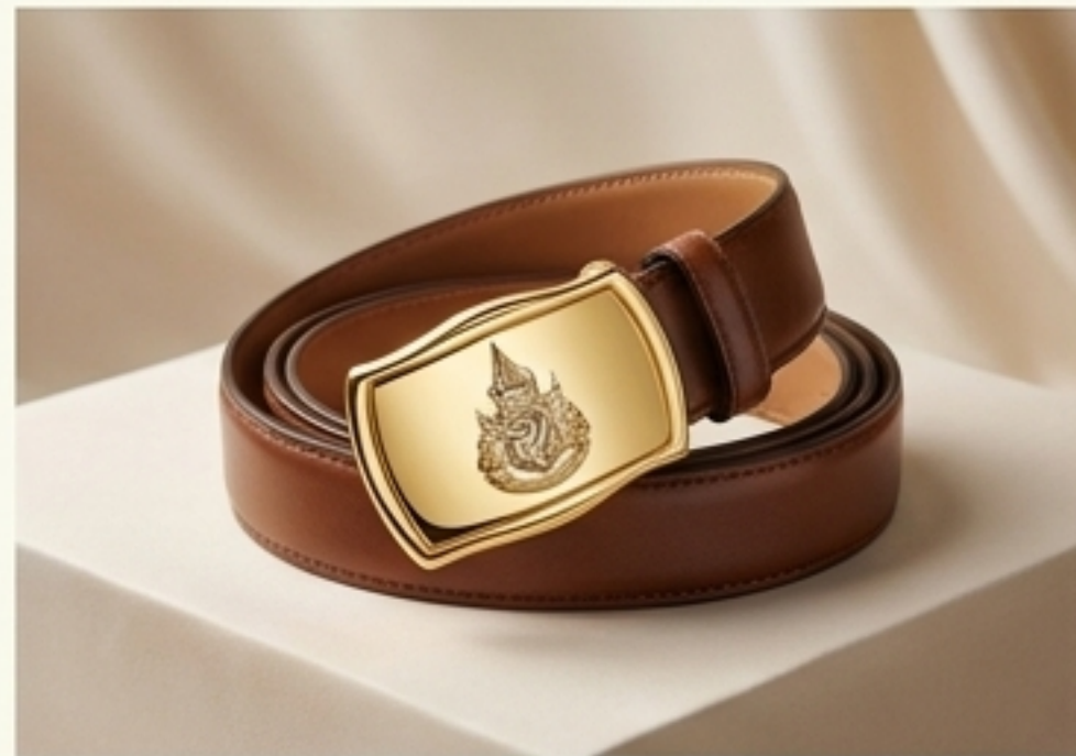
รัดพระองค์ (เข็มขัด)