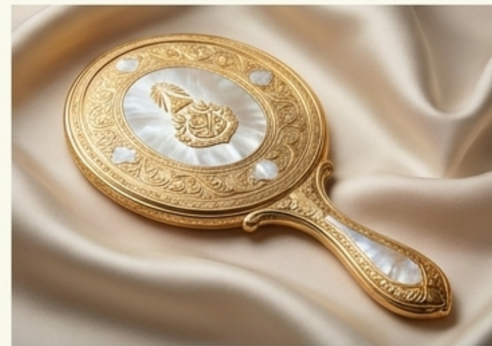
พระฉลอง (กระจก)