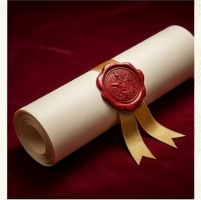
พระบรมราชโองการ (คำสั่ง)