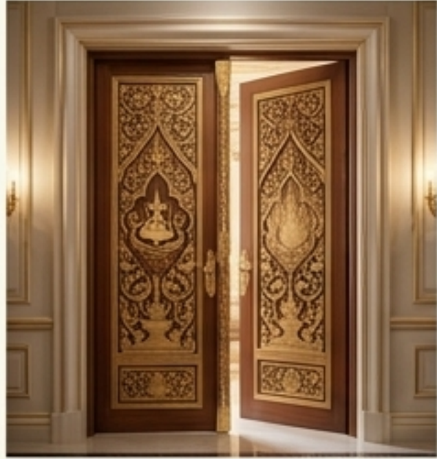
พระทวาร (ประตู)