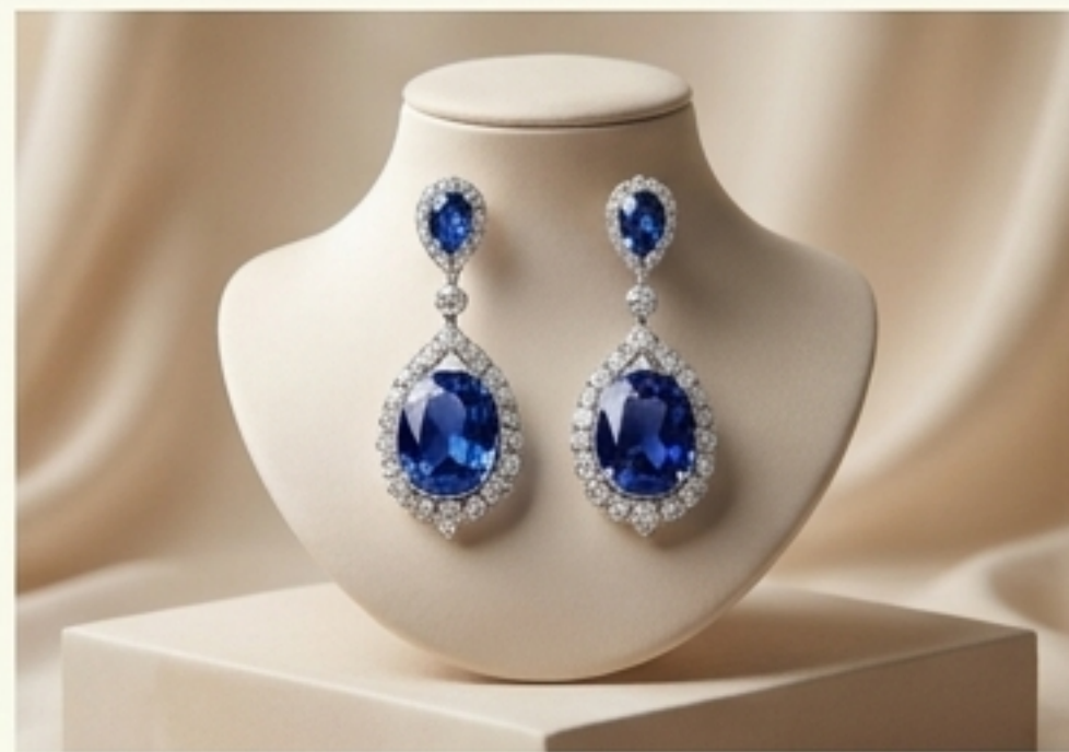
พระกฤษทล (ต่างหู)