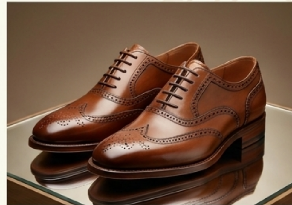
ฉลองพระบาท (รองเท้า)