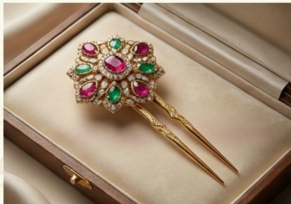
พระจุฑามณี (ปิ่น)