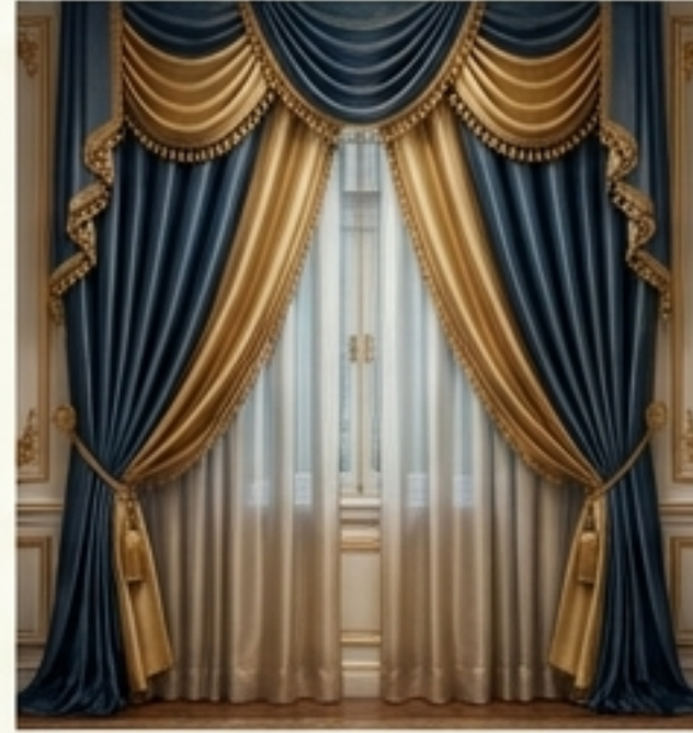
พระวิสูตร (ม่าน)