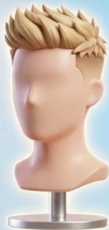
short hair (ผมสั้น)