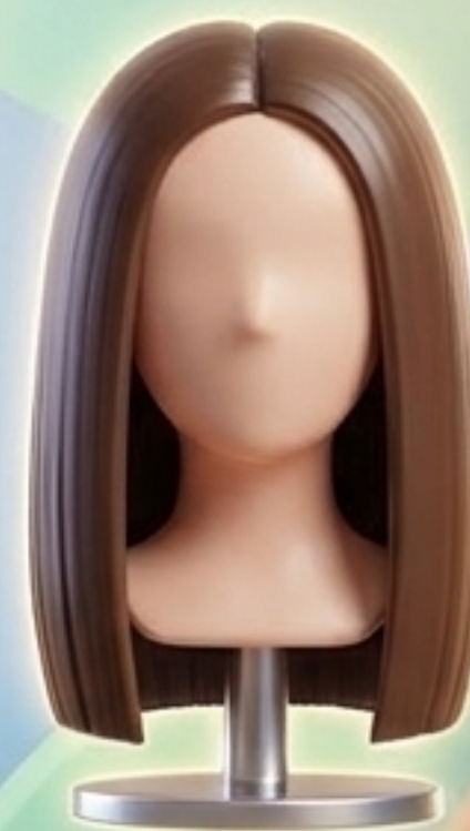
straight hair (ผมตรง)