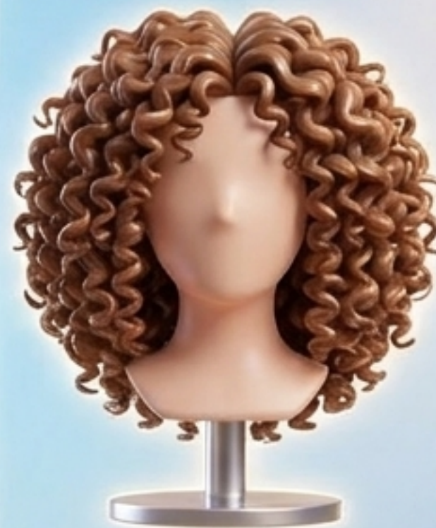
curly hair (ผมหยิก)