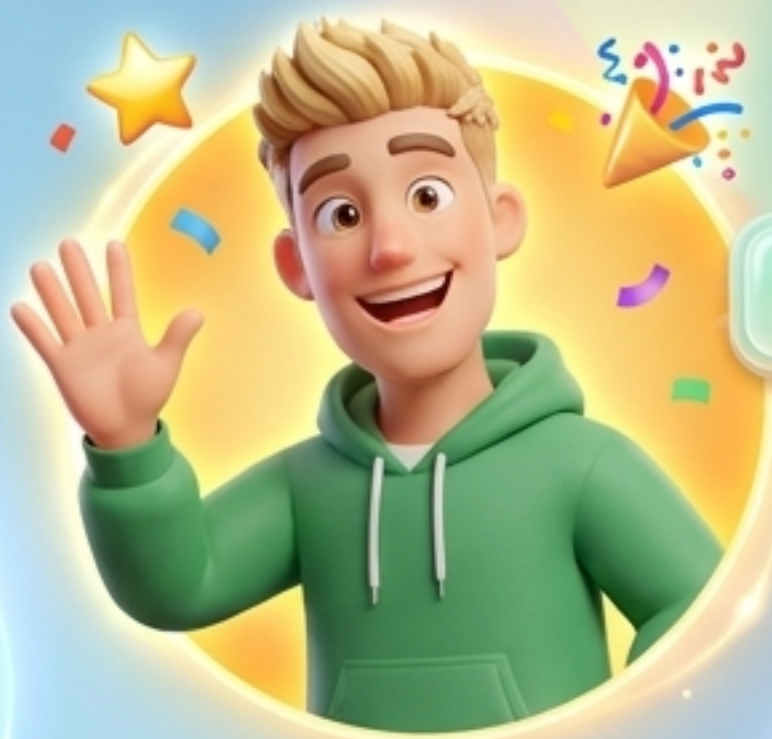
friendly (เป็นมิตร)