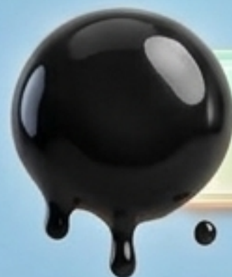
black hair (ผมสีดำ)