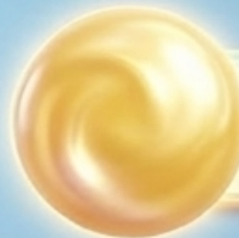
blonde hair (ผมสีบลอนด์)