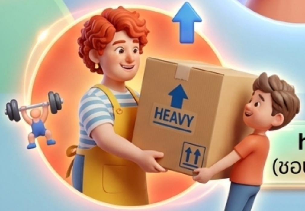
helpful (ชอบช่วยเหลือ)