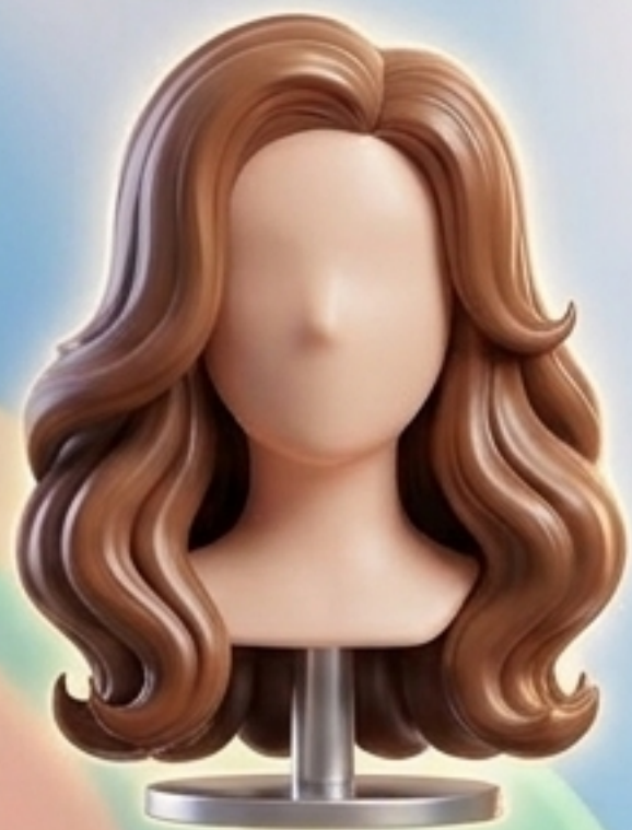
long hair (ผมยาว)