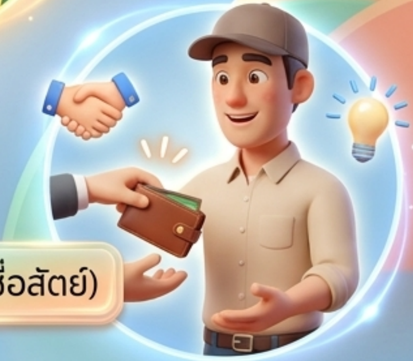
honest (ซื่อสัตย์)