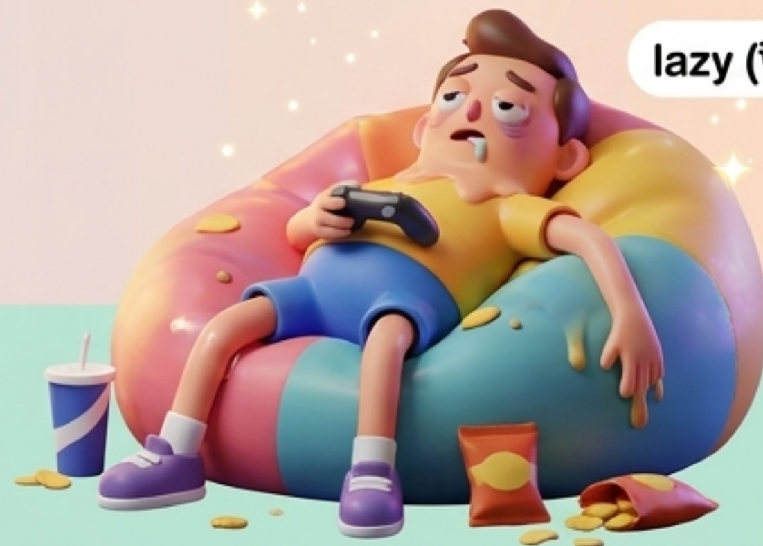
lazy (ขี้เกียจ)