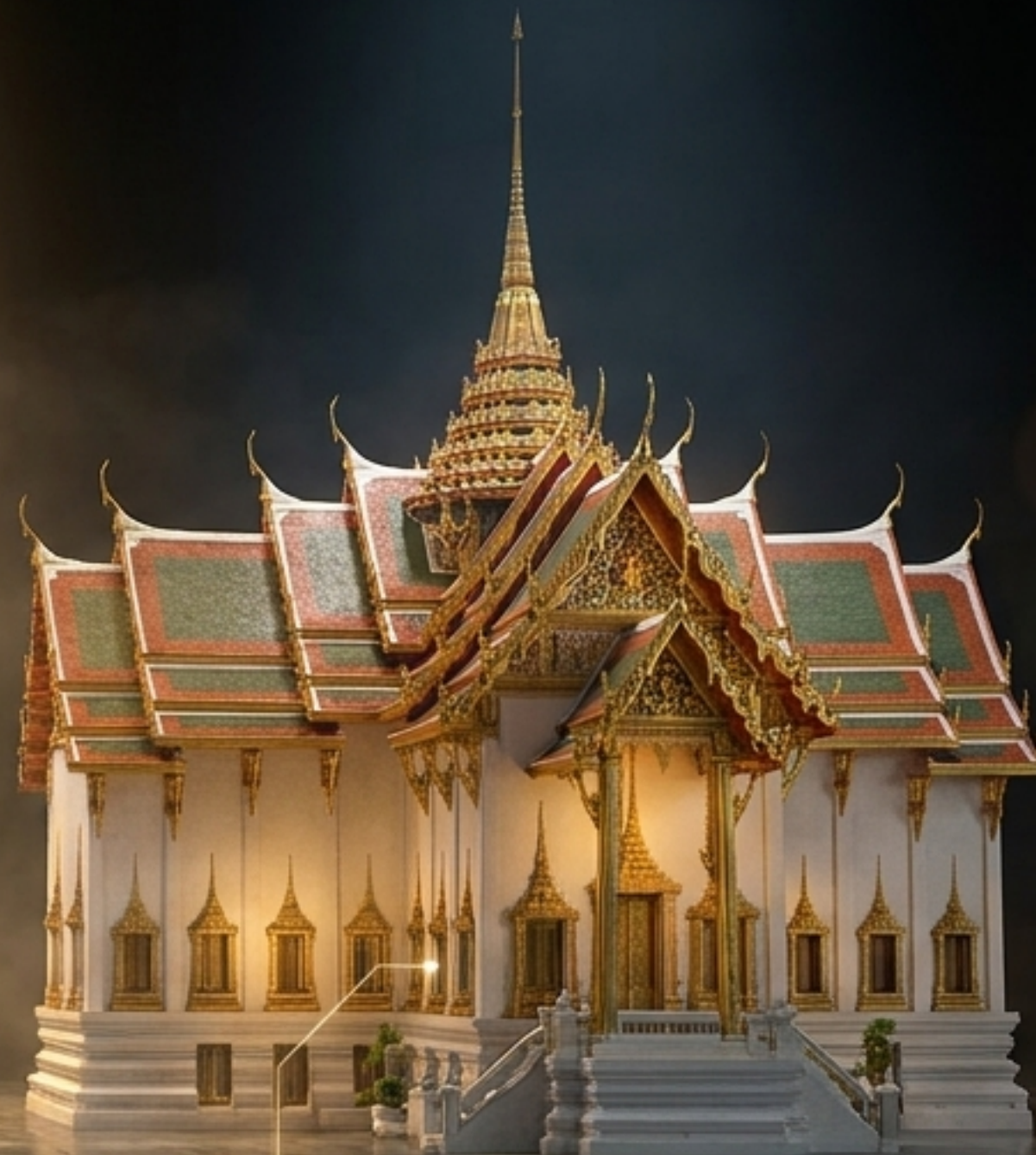
ยุครัตนโกสินทร์ (ผสมผสานศิลปะจีนและยุโรปอย่างลงตัว)