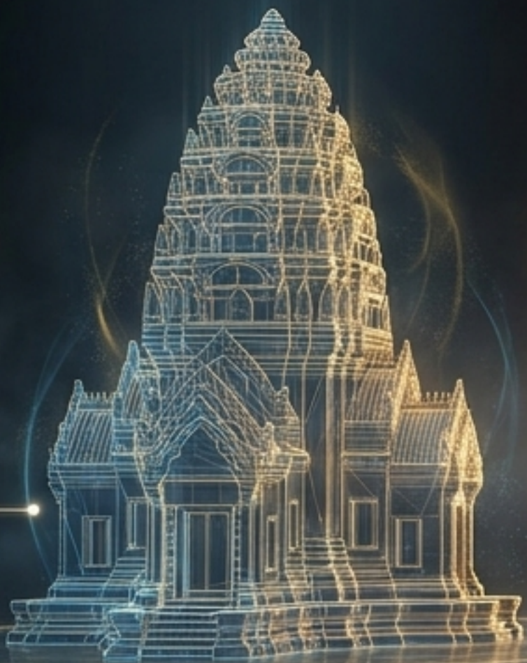
อิทธิพลอินเดีย/ลังกา/เขมร (ปราสาทเขมรรูปพระพุทธรูป)

สะท้อนความศรัทธา ความจงรักภักดี และการประยุกต์ใช้วัฒนธรรมต่างชาติ