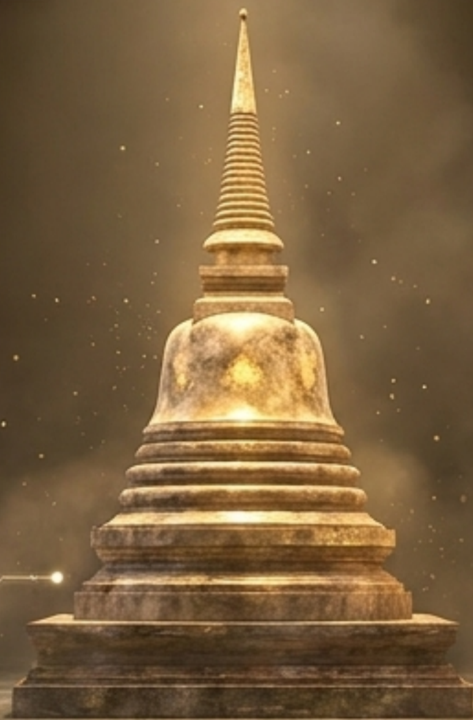
ยุคสุโขทัย (เจดีย์ทรงดอกบัวตูม - พุทธศิลป์จีนเป็นเอกลักษณ์)