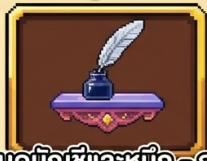
สมุดบัญชีและหมึก - การบันทึก