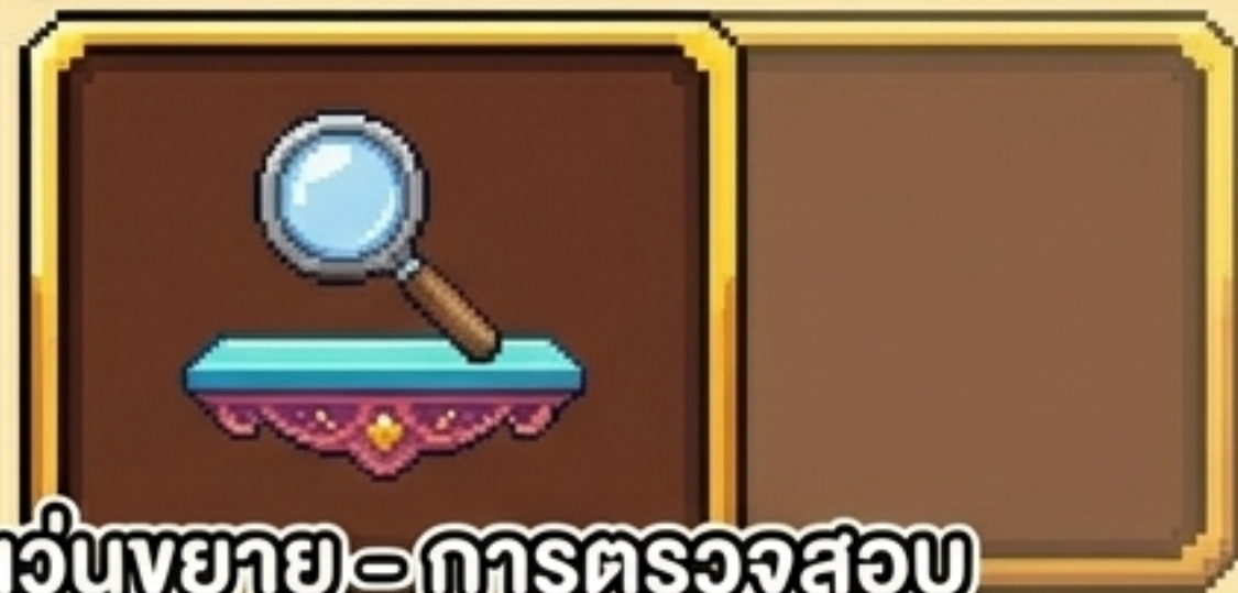
แว่นขยาย - การตรวจสอบ