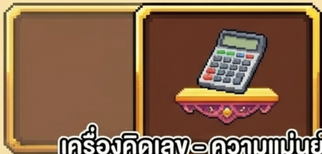
เครื่องคิดเลข - ความแม่นยำ