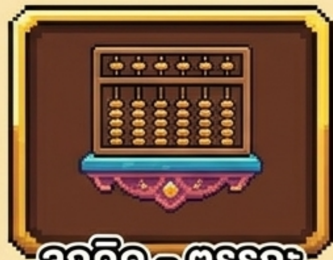
ลูกคิด - ตรรกะ