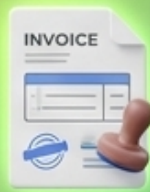
ลูกหนี้การค้า