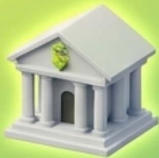
เงินฝากธนาคาร