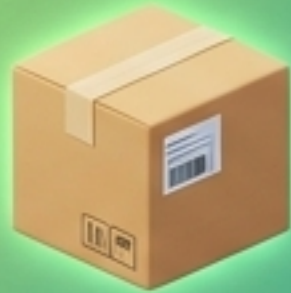
สินค้าคงเหลือ