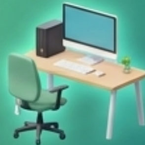
อุปกรณ์สำนักงาน