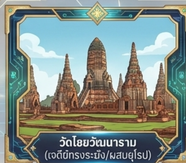
วัดไชยวัฒนาราม (เจดีย์ทรงระฆัง/ผสมยุโรป)