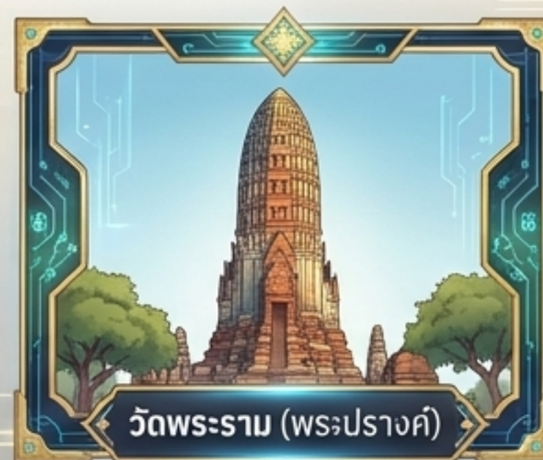
วัดพระราม (พระปรางค์)