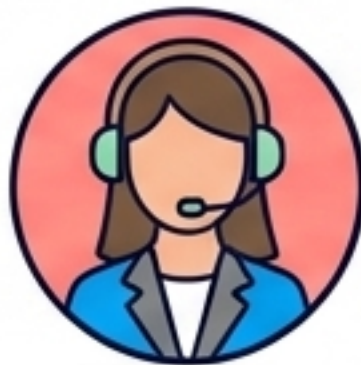
Customer Service Rep

I'm sorry for the inconvenience. Would you like a refund or an exchange? ขออภัยในความไม่สะดวกค่ะ ต้องการรับเงินคืนหรือ เปลี่ยนสินค้าค่ะ?